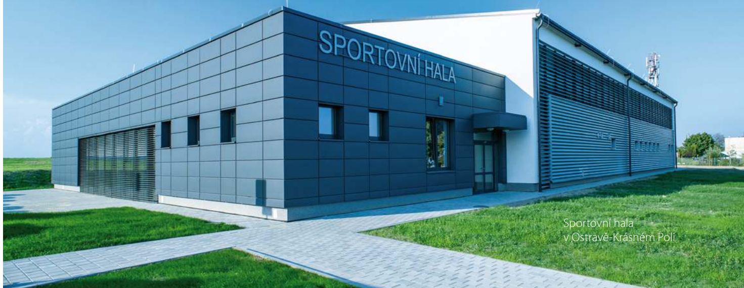
Sportovní hala v Ostravě-Krásném Polí

Sportovní haly dokážeme postavit během jediného roku