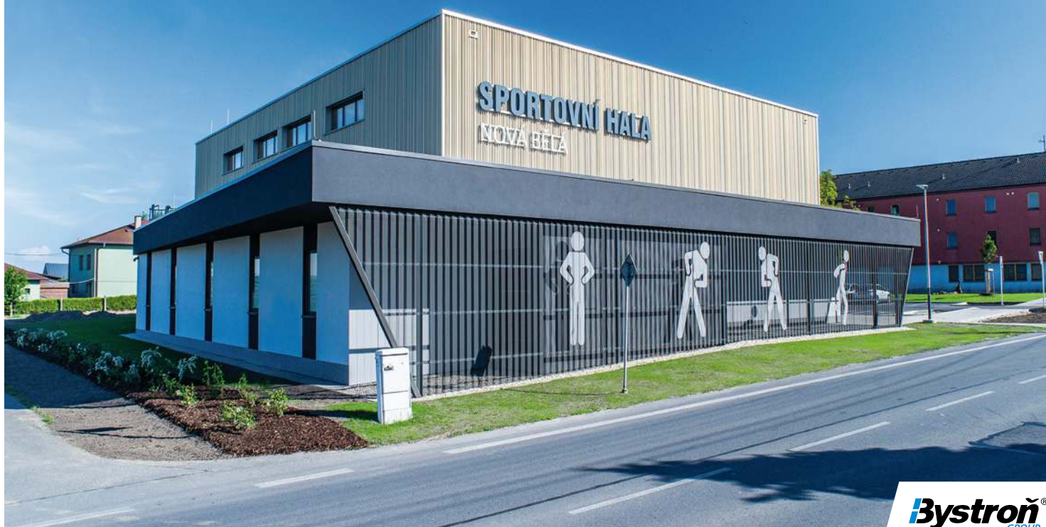
Sportovní hala v Ostravě-Nové Bělé